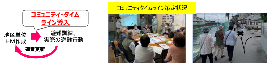
コミュニティタイムライン策定状況

令和4年度は引き続き コミュニティタイムライン未作成の市町に対する支援 に加え、これまでに 地区単位ハザードマップのみ作成済の地域 に対し、コミュニティタイムライン作成の取組を拡げていく。