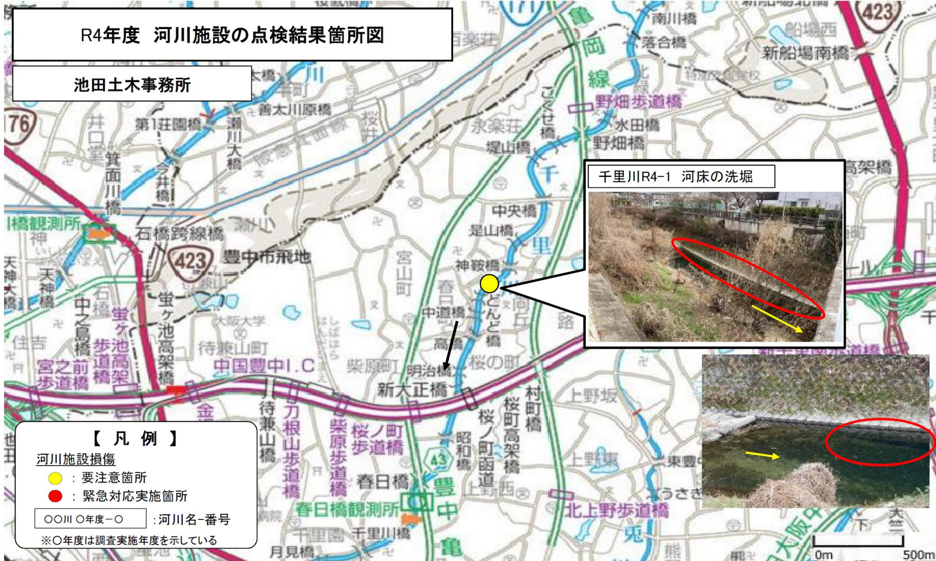
千里川R4-1 河床の洗堀