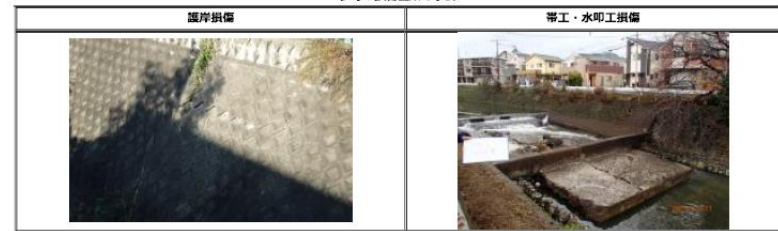
参考: 損傷箇所の事例