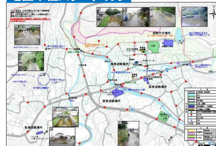
地区単位ハザードマップ