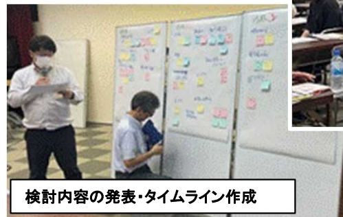
検討内容の発表・タイムライン作成