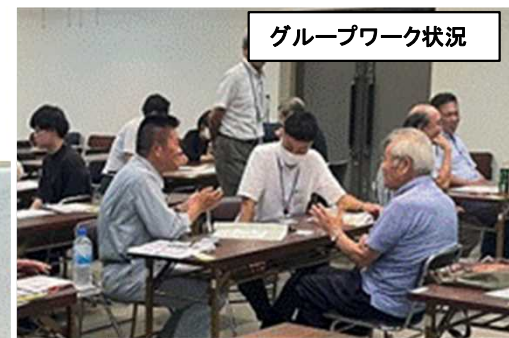
グループワーク状況

岸和田市内（R7.8.25）、大阪市内（R7.8.29）において、近畿建設協会の協力のもと、作成支援の講習会を実施