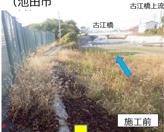
余野川改修 （池田市）