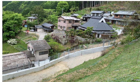
下止々呂美(8)地区急傾斜地 (箕面市域)