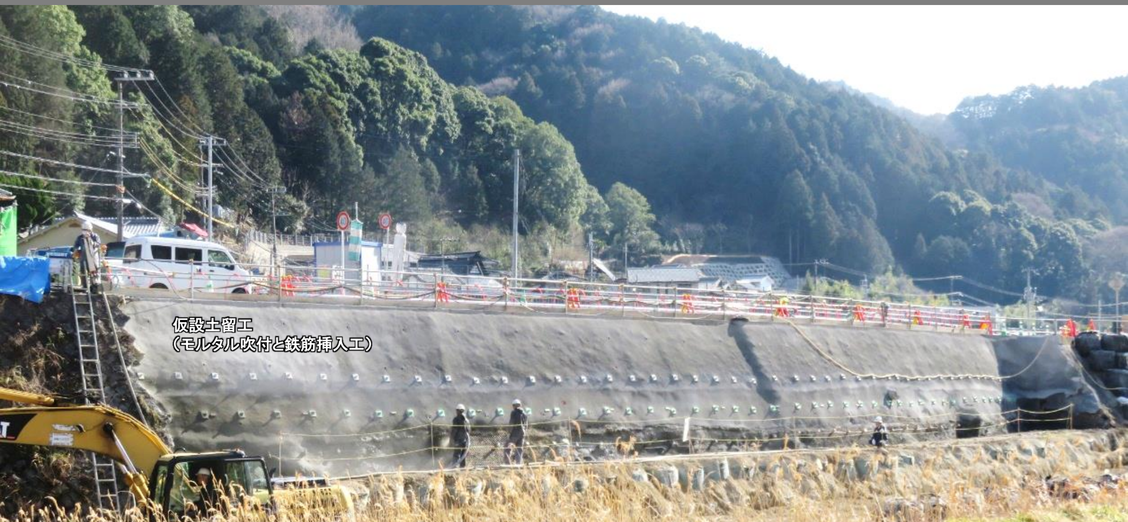
仮設土留工 (モルタル吹付と鉄筋挿入工)