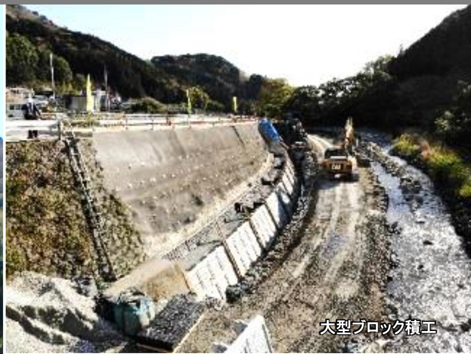
大型ブロック積工