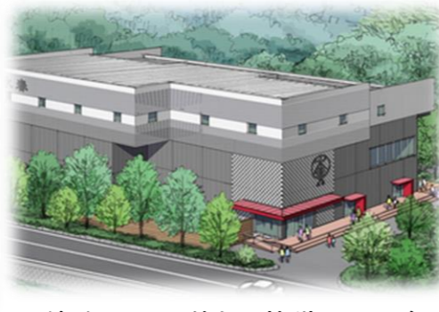
複合型温浴施設 整備イメージ (位置図②)