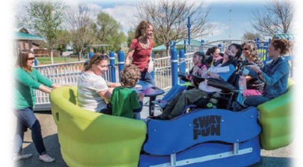
誰もが利用しやすい遊具 整備事例 (位置図⑩)