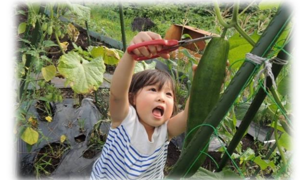
体験型農園 整備イメージ (位置図⑥)

【1】大阪の顔として多様な賑わいを創出 【2】地域の憩い・交流の機会の提供 【3】誰もが利用しやすい公園への進化