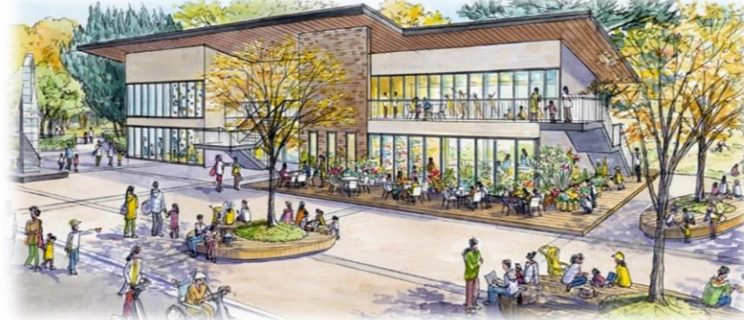
レストハウス 改修イメージ (位置図⑨)