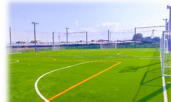
フットサルコート 整備事例 (位置図⑤)