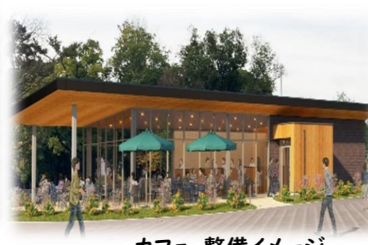
カフェ 整備イメージ (位置図①)