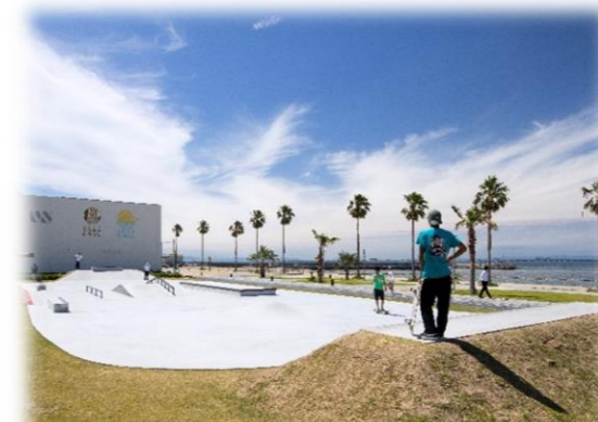
スケボーパーク 整備事例 (位置図④)

【1】多彩なスポーツにチャレンジできる機会の提供 【2】誰もが気軽にできる健康づくりのサポート