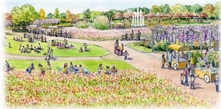
円形花壇 改修イメージ (位置図⑦)

【1】四季折々の顔を見せる美しい景観づくり 【2】自然と一体になり、リラックスできる空間の創出