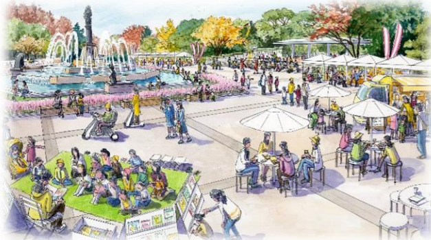
東中央広場 改修イメージ (位置図⑧)