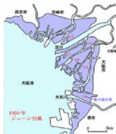
ジェーン台風による浸水区域

紀伊半島南部と四国の太平洋側に最多雨域があって、その山岳部では 400 mm を示した。内陸沿岸および大阪湾岸、淀川流域は 30 mm 以下となっており、降水による影響よりも、強風による影響の方が大きく、家屋の倒壊や港内船舶の被害が大きかった