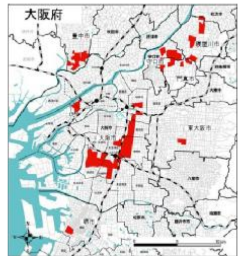
■地震時等に著しく危険な密集市街地

府に影響を及ぼす主な地震として、国の地震調査研究推進本部は、以下の地震の発生確率を公表している。南海トラフ沿いに発生する地震による地震動や津波による被害が、概ね100年から150年の間隔で発生し、今後30年以内に同地震が発生する確率は70%程度としている。