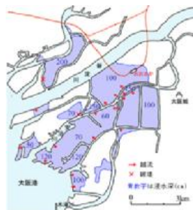
第 2 室戸台風による浸水区域

暴風、高潮および波浪等により西大阪、中之島一帯、泉北泉南海岸をはじめ、府下各地の人、家屋、港湾施設に甚大な被害を与え、その被害総額は約 1,200 億円 に及んだ。