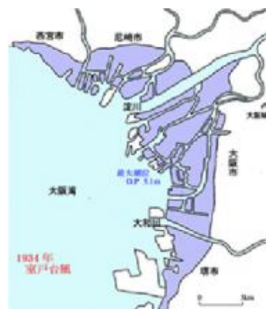
室戸台風による浸水区域

風速、潮位ともに超大型のもので、室戸で瞬間的には 60m/sec を記録したが、降雨は少なかった。西大阪一帯は浸水し、死者、行方不明者 1,888 人を数える大災害となった