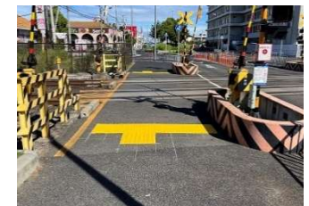
踏切外の誘導用ブロックの設置 （和泉市）