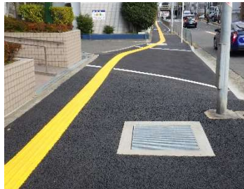
バリアフリー化（茨木市） （段差改善など）

Topics 令和4年4月に近鉄橿原線の踏切内で発生した視覚障がい者の死亡事故を受け、歩道のある踏切において踏切手前の誘導用ブロック設置を行いました。踏切内を含めたその他の対策については、国のガイドライン改定を踏まえ、引き続き実施していきます。