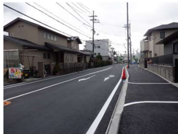
歩道の整備（寝屋川市）