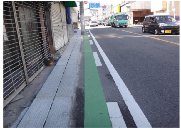
路肩のカラー化（河内長野市）