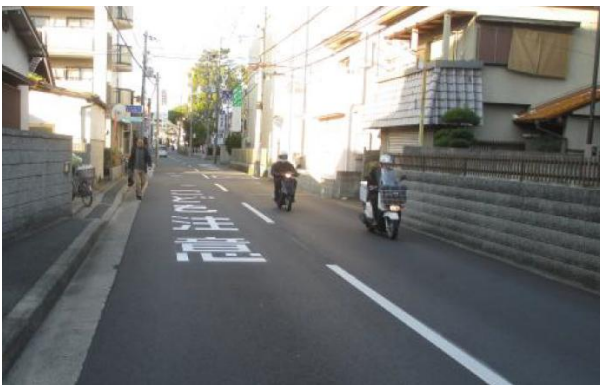
路面表示の設置 （こども注意）

通学路、幼稚園児や保育園児が日常的に集団で移動する経路等において、市町村・道路管理者・警察等との合同点検の結果に基づき要対策箇所に対し、対策が可能な箇所から順次対策を実施します。