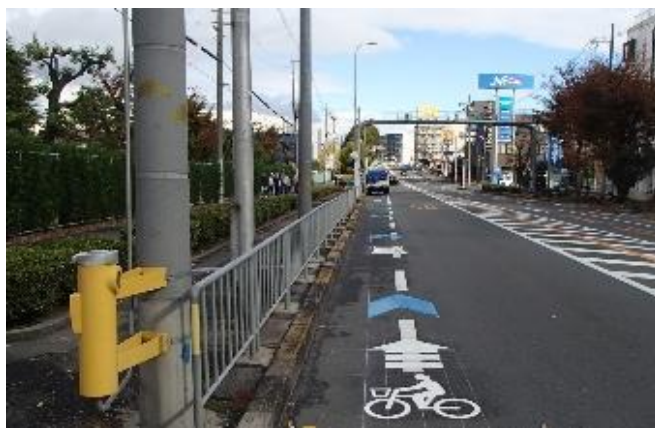
自転車通行空間の整備