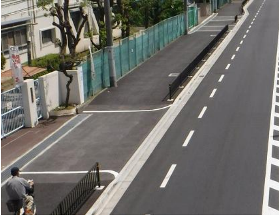
歩道の整備（吹田市）

通学路や未就学児の移動経路、歩行者や自転車の交通量が多い道路、バリアフリー法に基づく特定道路などにおいて、歩道の整備や路肩のカラー化などを行い、歩行者等の安全な通行空間の確保を図ります。