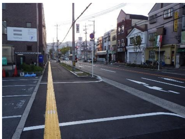
視覚障がい者誘導用ブロック設置