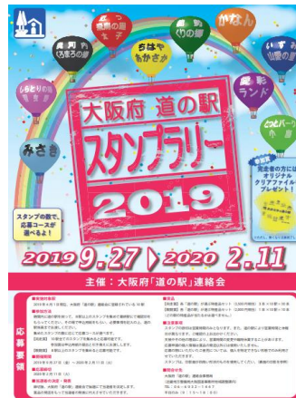
大阪府「道の駅」 スタンプラリー