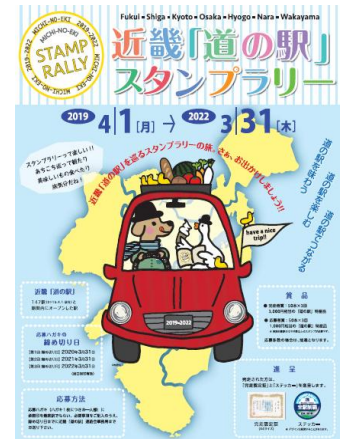
近畿「道の駅」 スタンプラリー

大阪府内の道の駅：「ちはやあかさか」「近つ飛鳥の里・太子」「能勢（くりの郷）」「かなん」「しらとりの郷・羽曳野」「いずみ山愛の里」「とっとパーク小島」「愛彩ランド」「みさき」「奥河内くろまろの郷」