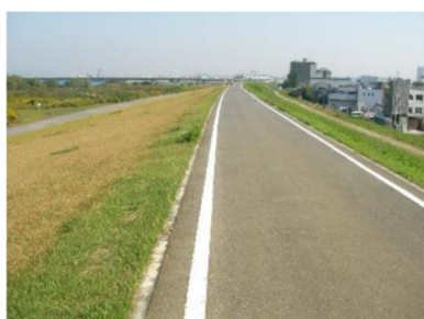
既存の大規模自転車道 （北河内サイクリン）

既存の大規模自転車道を活かした、広域につながる自転車の通行空間において、大阪市や堺市などの関係機関と連携し、路面表示によるルート案内や注意喚起など、安全で快適な自転車通行環境の充実に努めるための検討を進めます。