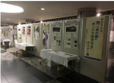
「道の駅」ポスター展 (JR北新地駅：曾根崎地下歩道)

大阪府「道の駅」連絡会において、大阪府内の道の駅と連携し、大阪市内でのPRイベントやスタンプラリーの実施などにより、情報発信機能の拡充や大阪府「道の駅」全体の活性化を図ります。