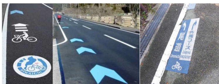
路面表示の設置例（ビワイチ、しまなみ海道）