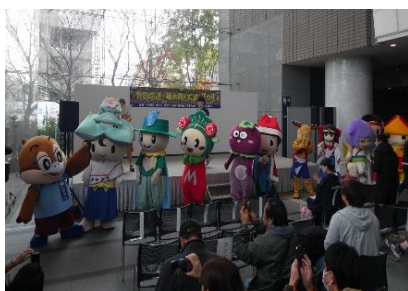
竹内街道・横大路（大道）まつり