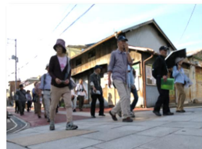
ウォークイベント