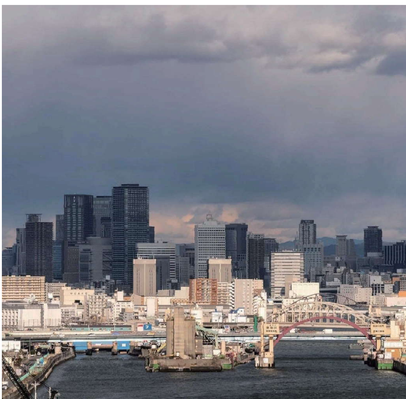
アーチ型が連続する景色