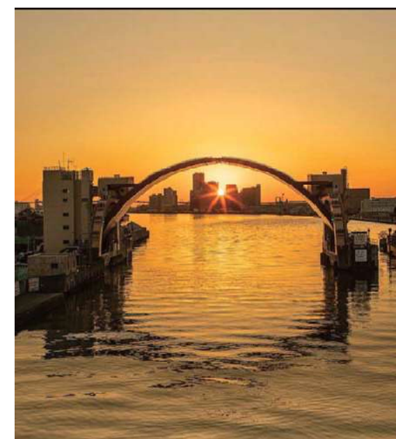
アーチ越しにみた夕日