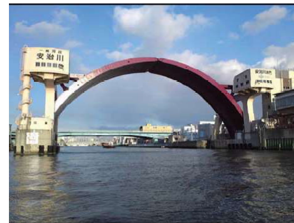
アーチ型の安治川の玄関口