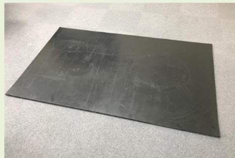
211011・リプラギフロアーマット(K3)