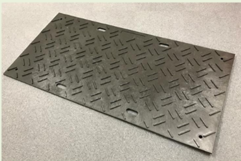
211010・リプラギフロアーマット(K1)