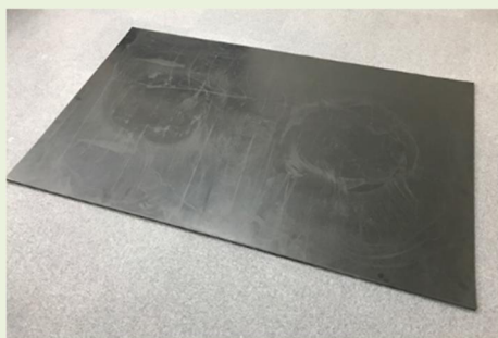
211012・リプラギフロアーマット(K6)