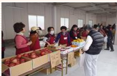
東北3県の物産販売