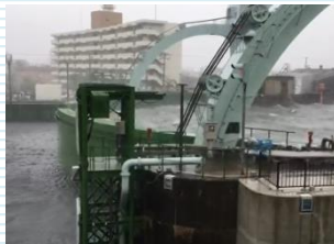
H30年台風21号映像 西大阪治水事務所