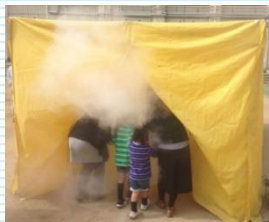
煙テント体験 大阪市西消防署