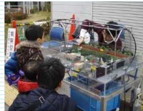
水災害現象観察型 ジオラマ模型展示・解説 関西大学 環境都市工学部