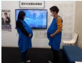
妊婦や子供を抱えた人の 災害時の不自由さ体験 西区社会福祉協議会