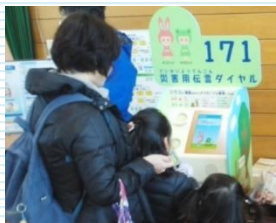
災害用伝言ダイヤル171体験 NTT西日本 大阪支店