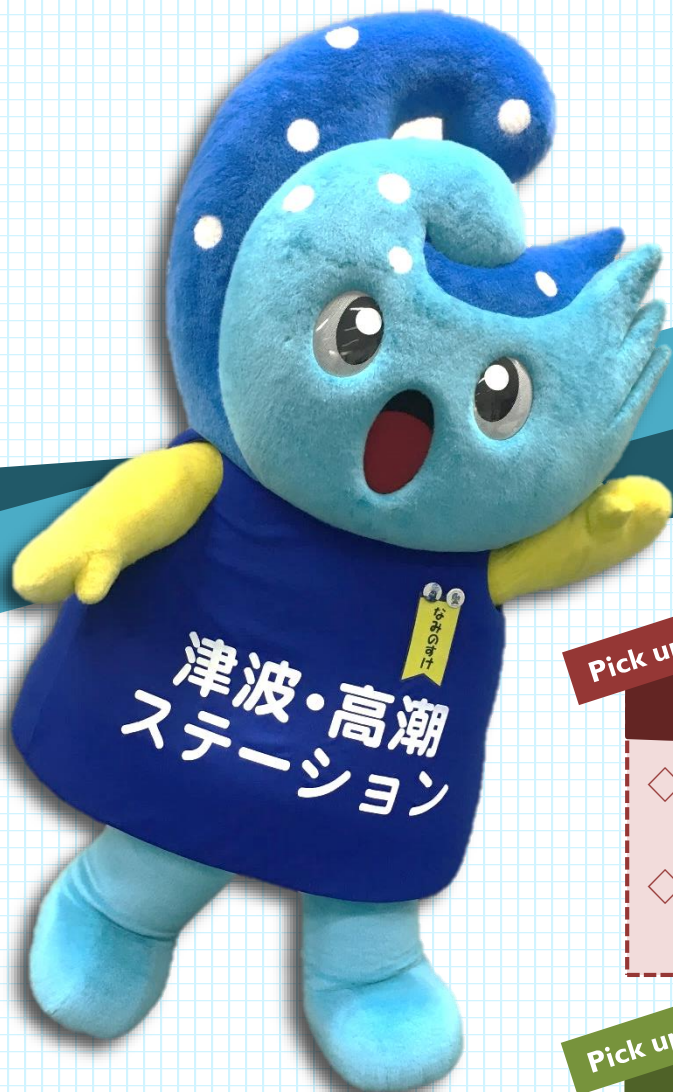
津波・高潮ステーション マスコットキャラクター なみのすけ