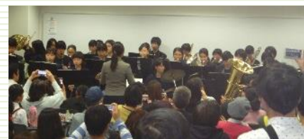
吹奏楽 花乃井中学校