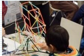
体験型防災教育プログラム つなたかLab. (関西大学 社会安全学部)