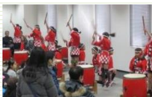
和太鼓 本田小学校