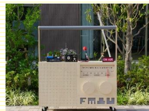
ミニFMえのこじま凸凹ラジオ

enocoと、enocoを拠点に活動しているボランティア（ポッセ）メンバーで運営しているミニFMラジオ局。江之子島2丁目付近で楽しめます。