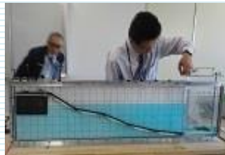
つなみ博士 実験コーナー 大阪管区気象台