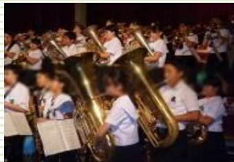
吹奏楽 花乃井中学校