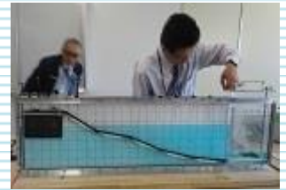
親子で学べる実験 大阪管区気象台