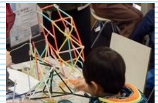
体験型防災教育プログラム 関西大学 社会安全学部