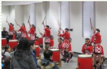
和太鼓 本田小学校