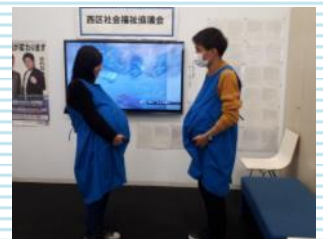
妊婦や子供を抱えた人の 災害時の不自由さ体験 西区社会福祉協議会