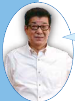
大阪市長 松井一郎

4つの特別区を設置することで、地震や豪雨など、災害発生時の情報収集や被災状況を踏まえた対応をより迅速に行いやすくなります。