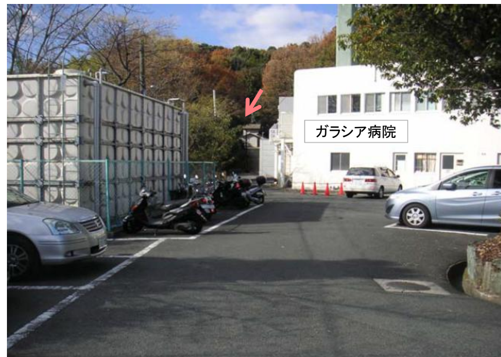
保全対象(病院)から事業対象溪流を望む