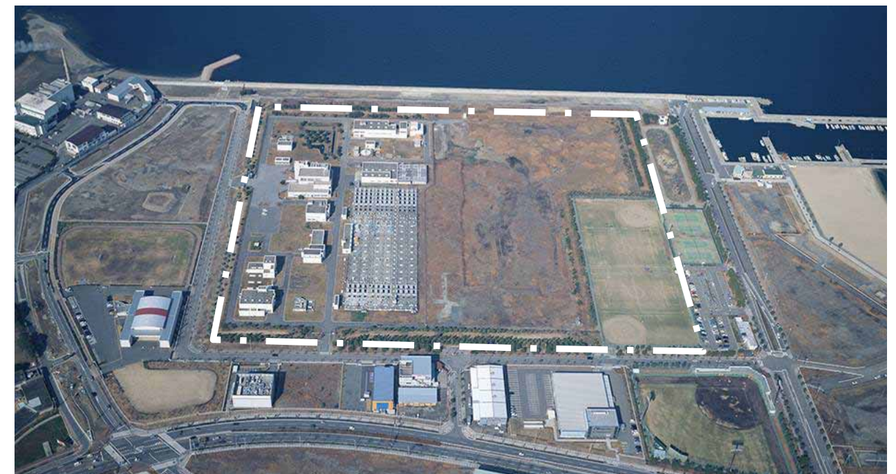
南部水みらいセンター(処理場)