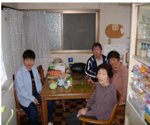
「リビングで団欒する入居者と世話人」