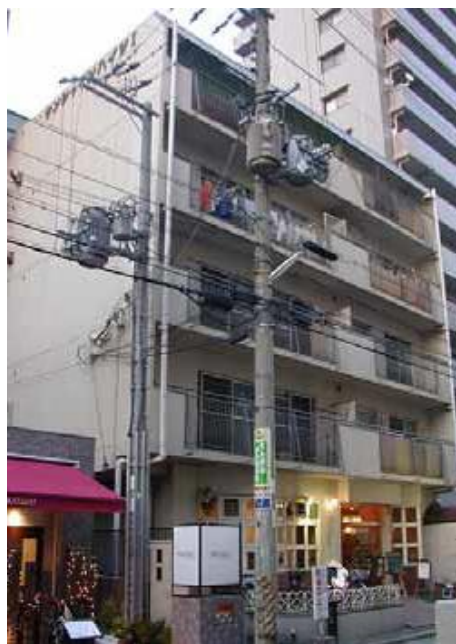
「都市部における集合住宅を活用したグループホーム」