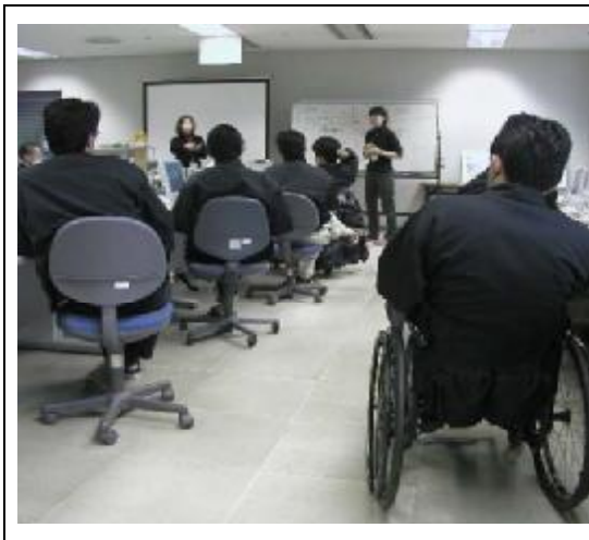
「システム開発の講義を受けています」

適用される規制の特例措置 : ・講座修了者に対する初級システムアドミニストレータ試験の一部免除 ・講座修了者に対する基本情報技術者試験の一部免除