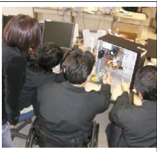
「パソコンの仕組みを学んでいます」