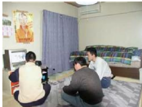
事務所（共同生活住居）内での交流