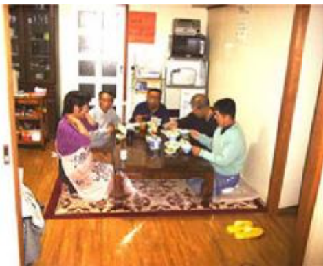
事務所（共同生活住居）内での食事