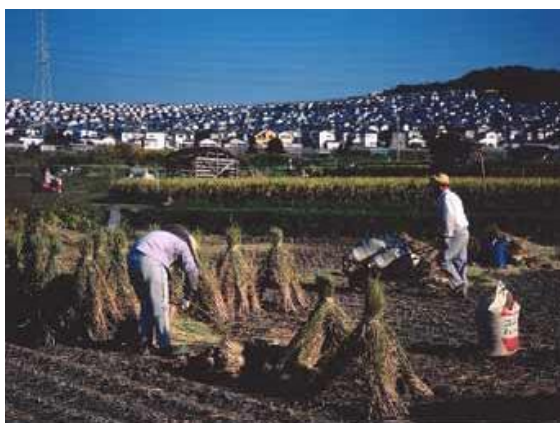
都市住民も農業参画