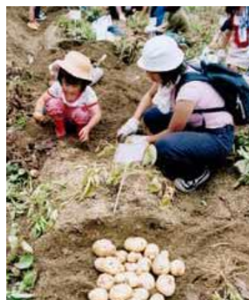
市民農園で農作業