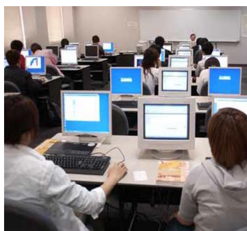
I T 資格に関連する講座の様子