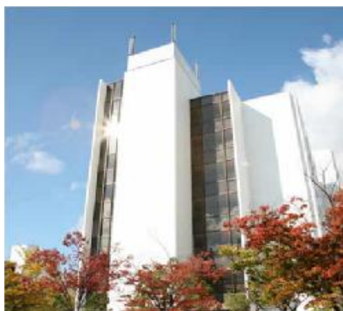
講座を設置する事業体の外観