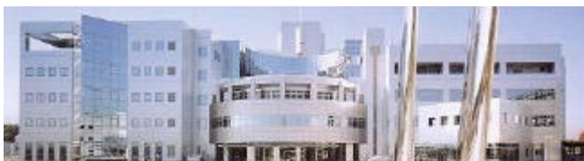
【府立産業技術総合研究所】