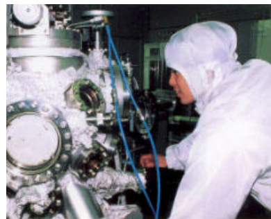
【ハイテク研究の推進】