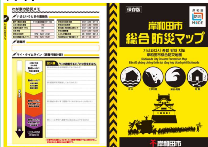
【岸和田市総合防災マップ】

岸和田市では、災害時の被害を最小限にとどめるため、市民の皆様には防災に関する知識の習得や危険箇所を把握していただくことを目的に「岸和田市総合防災マップ」を作成し、防災情報の提供を行っております。