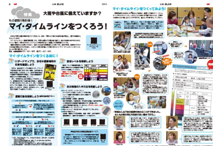
【広報きしわだ令和5年6月号】

岸和田市では、出前講座や広報紙などの周知活動により、市民の防災意識を高めるとともに、住民一人ひとりの行動計画であるマイタイムラインの作成につながるよう取り組んでいる。