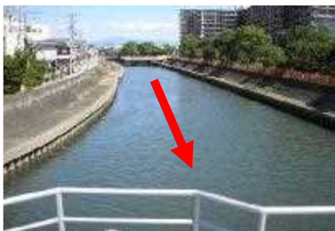
新春木橋より上流