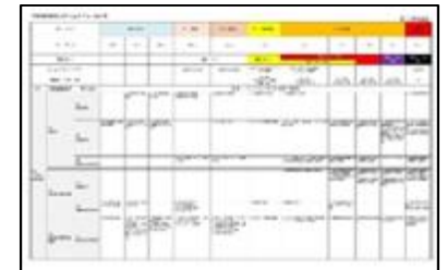
神崎川流域洪水タイムライン

大阪府では、令和3年度に流域市、国、ライフライン事業者、鉄道事業者などの防災機関と連携して「神崎川流域洪水タイムライン」を策定。