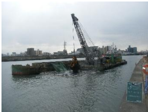
神崎川河床掘削工事

河床掘削のほか、下水道等排水施設整備の推進により、40年に1度程度発生する恐れのある降雨に対し、家屋床上浸水が解消される。