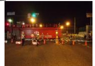
防潮堤点検操作訓練 (左門橋)

台風による高潮の際に防潮鉄扉を閉鎖し大阪市内等を浸水被害から防ぐため、台風期に備え、国道2号及び周辺道路を通行止めし、防潮鉄扉閉鎖訓練を実施。