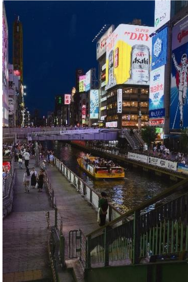
撮影場所:道頓堀川