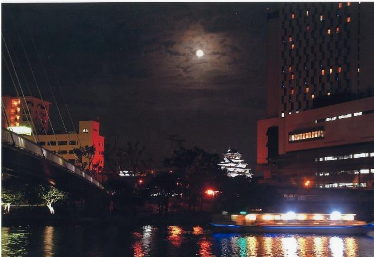
撮影場所:大川(大阪市北区天満)