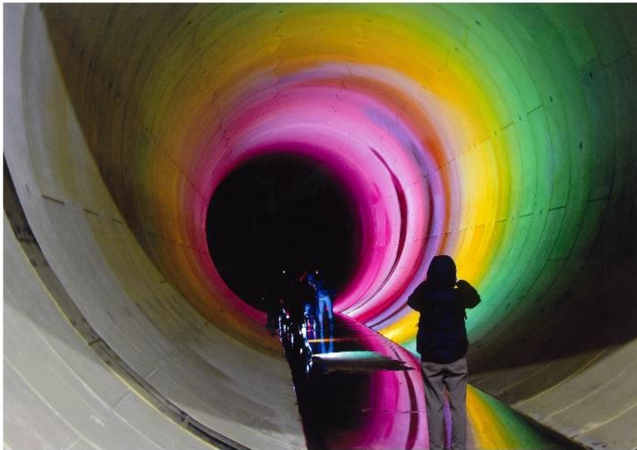
撮影場所:寝屋川南部地下河川(若江立坑)