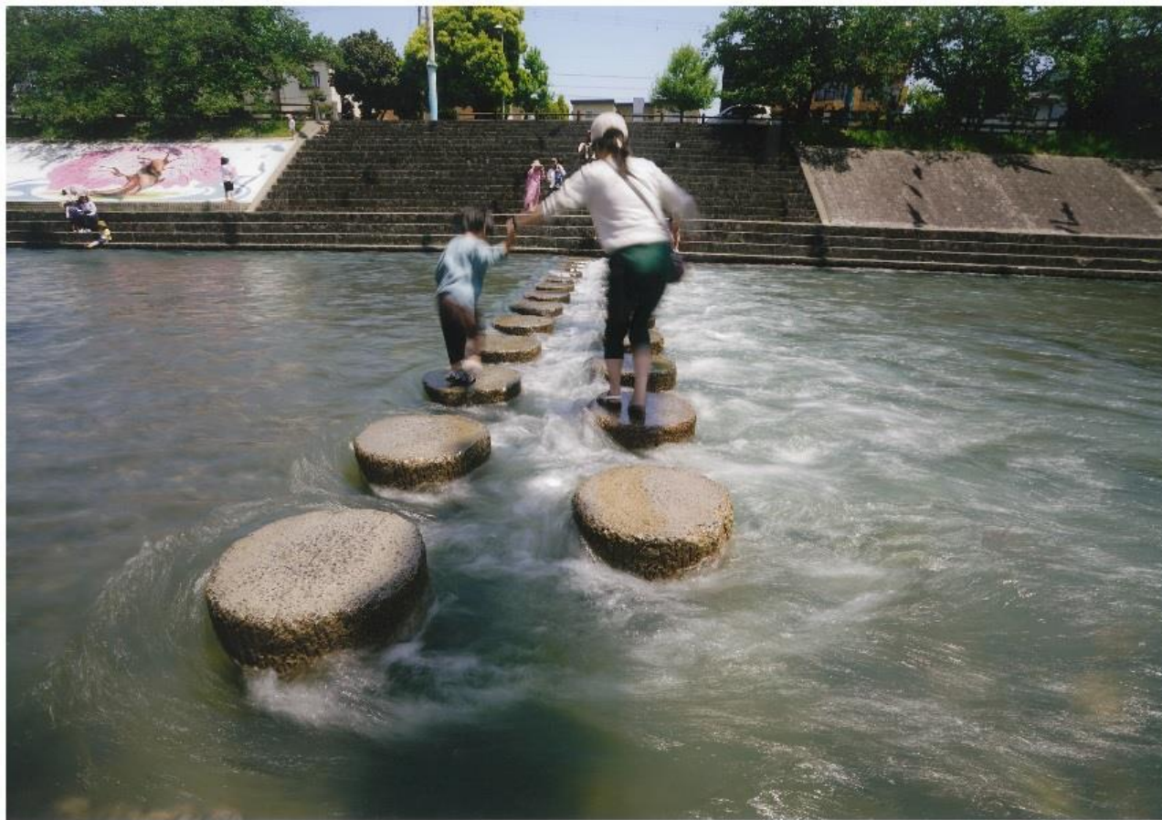
撮影場所:芥川