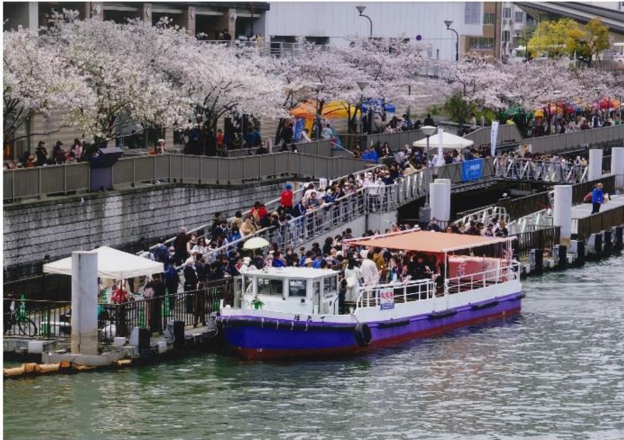
撮影場所:大川