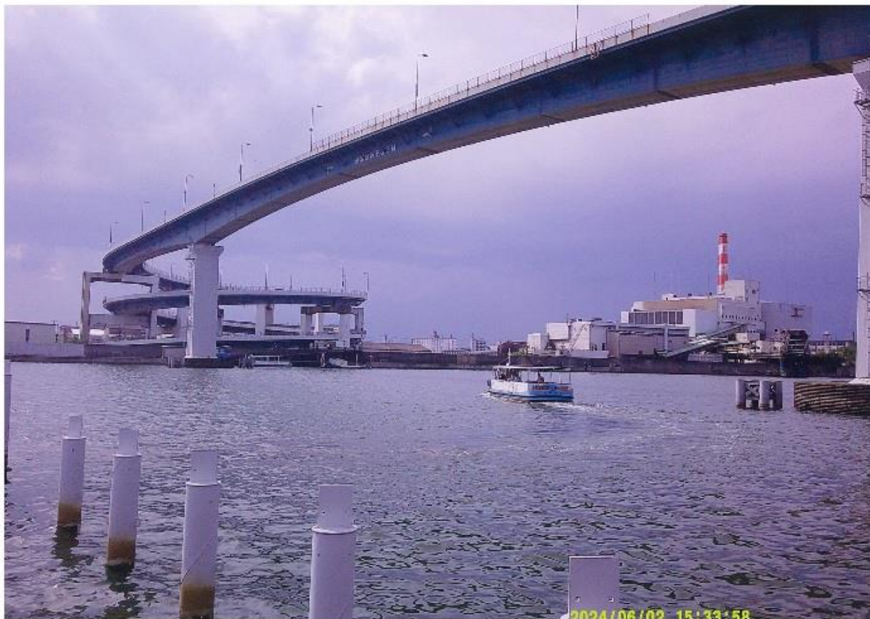
撮影場所:木津川