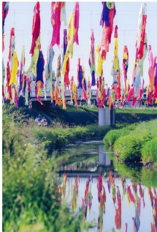
撮影場所:大正川