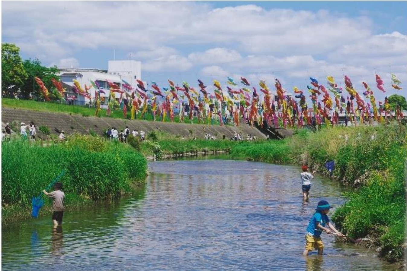
撮影場所:大正川