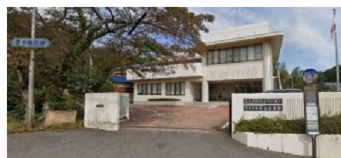
保全対象：市役所・公民館