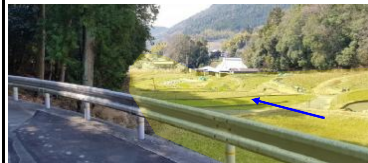
保全対象と下流方向の位置関係