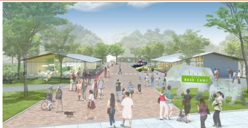
(谷町筋からの景観イメージ)