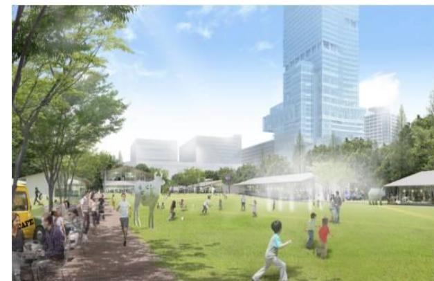
(芝生広場のイメージ)