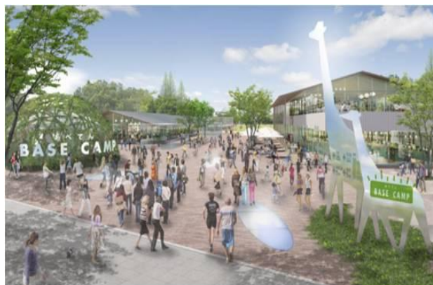
(東端谷町筋から西向きイメージ)