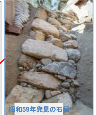
昭和34年発見の石垣