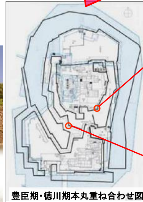
豊臣期・徳川期本丸重ね合わせ図