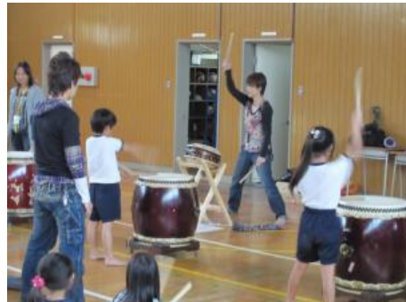
「講座」和太鼓 (体育館にて)