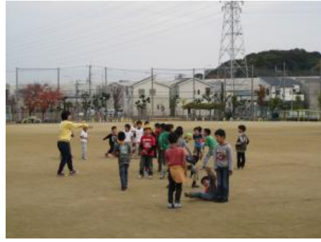
「講座」ドッジボール (運動場にて)