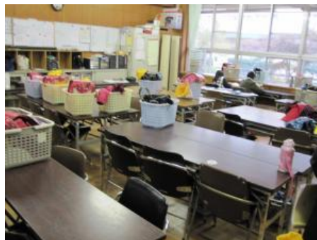
元気広場活動に参加する時に児童が最初に来る部屋