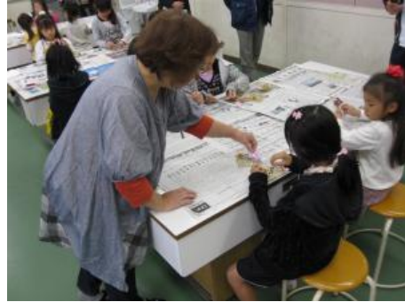
「講座」フラワーアレンジメント (家庭科室にてクリスマス飾りを作成中)