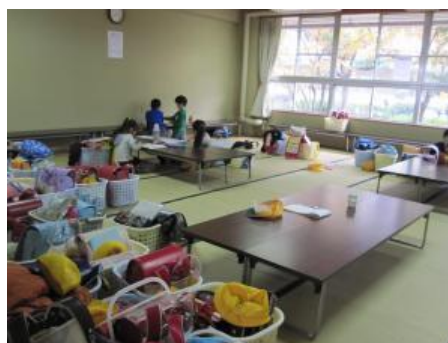
出欠確認の後、児童はまず宿題に取り組む (宿題室)