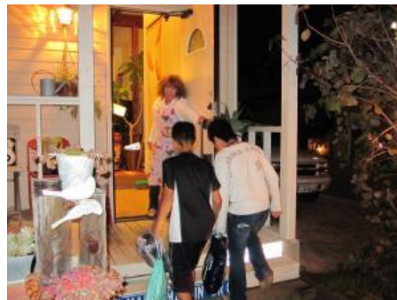
もらい湯 入浴は地域のご家庭に協力していただきます