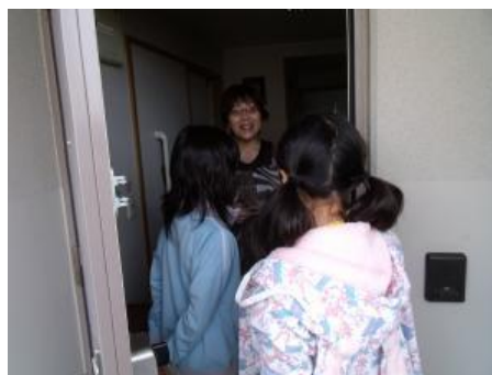
作成した記念品を持って、もらい湯家庭をお礼に訪問（3日目）