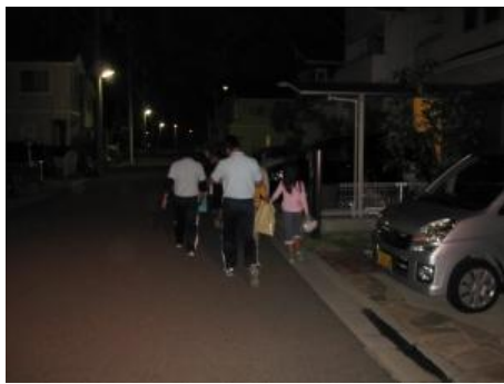
スタッフが付き添いもらい湯のご家庭へ向かう