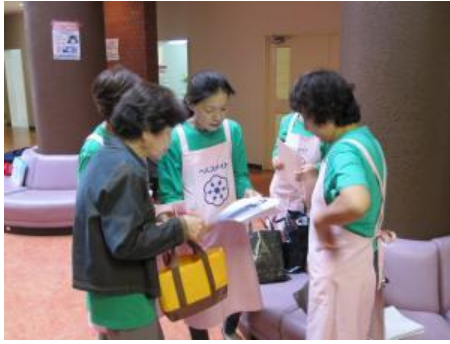
夕食の支度のお手伝いに向けて 「食生活改善推進協議会」の方々との打ち合わせ