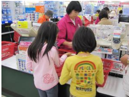
食材買出しの支払いをする参加児童