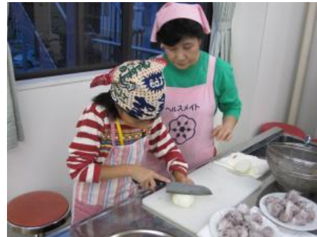
夕食の調理をする参加児童