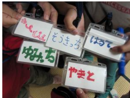
参加児童それぞれが名札を作成