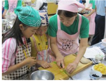
お手本を見せて夕食の調理をお手伝い