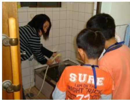
ご家庭でお風呂の使い方の説明を受ける