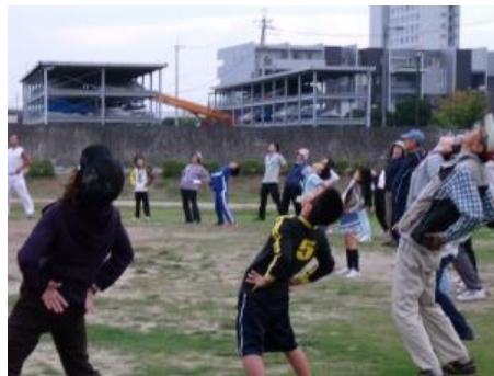
朝のラジオ体操（2日目・3日目）