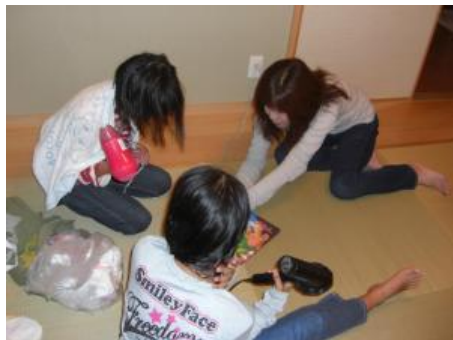
入浴後、お家の方と楽しくお話ししました