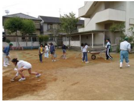
小学校で冬芝の種まきに参加（3日目）