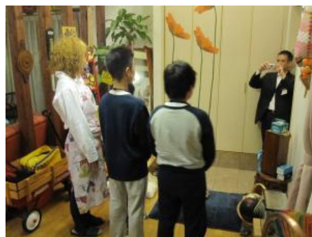
記念品作成用の写真を撮影（1日目）