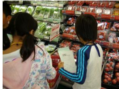
支援を受けながら地域のスーパーマーケットで夕食の食材買出し