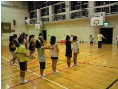
体育館でのレクリエーション