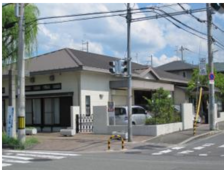
老人憩いの家明寿荘