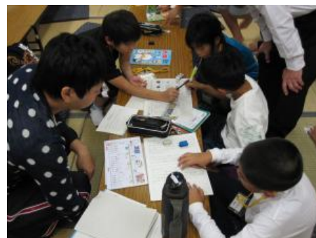
大学生と学習活動