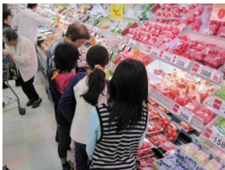
地域のスーパーマーケットで買出しをする児童

シルバー人材センターの人たちの協力を受けて、地域のスーパーでの買出しや夕食の調理が行われました。