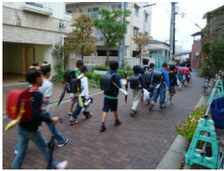
朝、自治会館から「登校」する様子