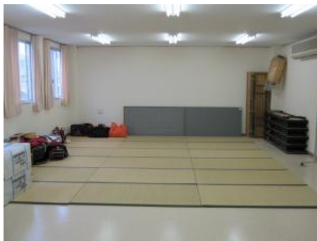
宿泊場所の自治会館