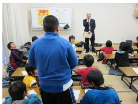
振り返り共有の時間