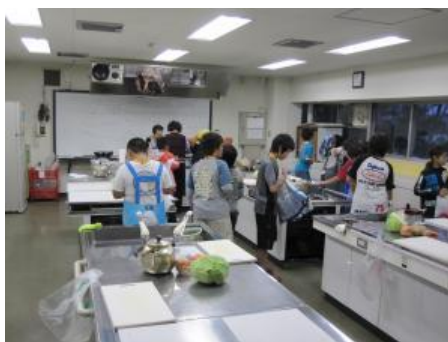
市立文化会館の調理室