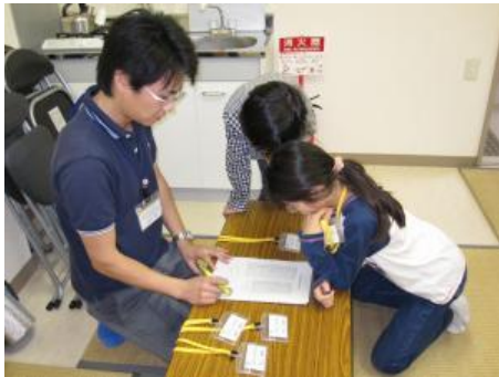
開会前の受付の様子