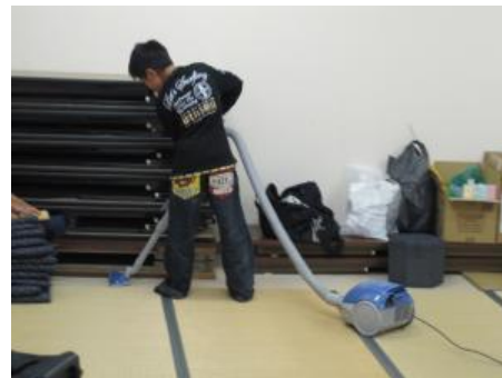
自治会館での清掃活動