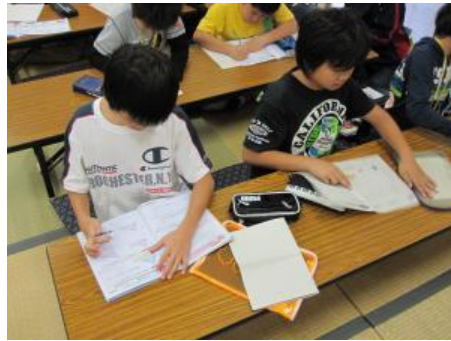
最終日の待ち時間、自主的に学習が始まった