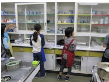
自ら役割を見つけ夕食の片付け