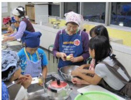
お手本を見て夕食の調理をする児童