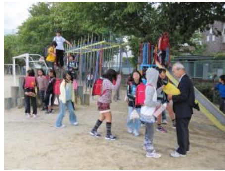
放課後、学校で集合し自治会館へ「帰宅」する