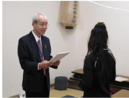
最後にひとり一人に修了証を授与