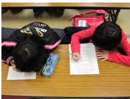
閉会后、振り返りシートを記入