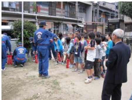
地域の公園での消防団による防災講座