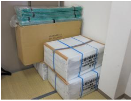
門真市から貸与された毛布