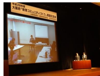
実践報告・リレートークの様子