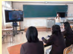
中国の現地校とのオンライン交流

在外教育施設の教育や運営について、「在外教育アドバイザー」が在外教育施設からの相談に対し指導・助言を行う。