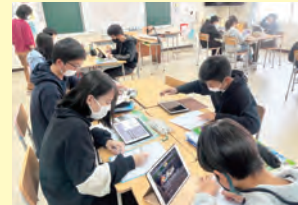
ハノイ日本人学校 タブレットを活用した授業

新型コロナウイルス感染症の世界的な影響により在外教育施設(日本人学校(高等部を含む)、私立在外教育施設(高等部を含む)、補習授業校)に生じた様々な課題に対応し、児童生徒の学びの保障を図り、非常時でも途切れない教育体制を強化するために、公益財団法人海外子女教育振興財団が行う、在外教育施設による感染症対策の取組に対する支援に係る費用を補助。