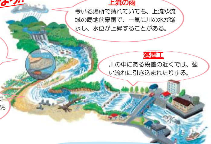
(公財) 河川財団 水辺の安全ハンドブックより

一見穏やかに見える流れも、川底の影響で流水は一定ではない。川の事故の約 90% はこの穏やかな流れで発生している。