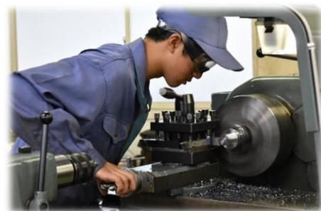
全国ものづくりコンテスト 旋盤加工部門出場

入学定員を工業科一括募集し、入学後半年間にわたり6学科の内容を学習するなかで、希望する学科を選びます。ものづくりが好きだけど、どの学科を選べば良いか迷っているあなた。ぜひ本校で学んでください。実際に経験することで自分に合った学科が見つかるはずですよ。