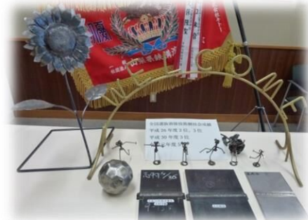
全国選抜溶接技術競技大会 準優勝、3位 (2回)