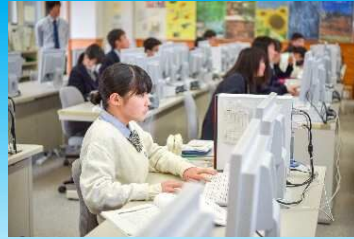
「総合情報ビジネス」