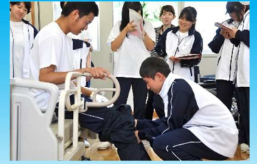
「福祉ライフデザイン」