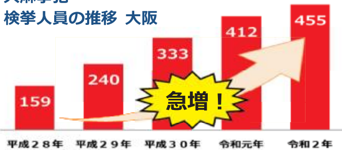
大麻事犯 検挙人員の推移 大阪