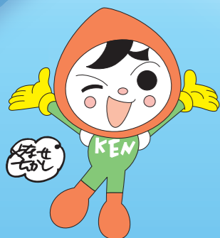
人権イメージキャラクター 「人KENまる君」