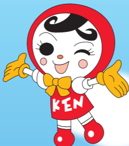
人権イメージキャラクター 「人KENあゆみちゃん」