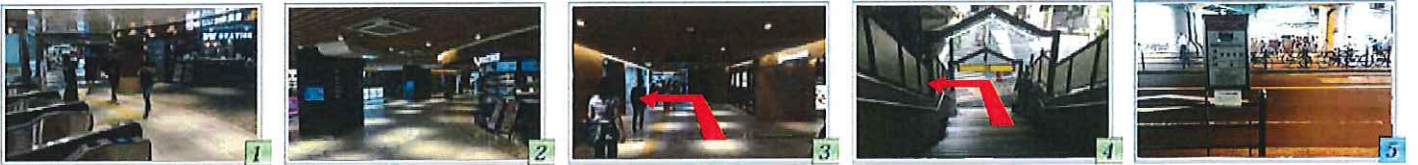
1 新なにわ大食堂直結、Osaka Metro 御堂筋線 新大阪駅 北東改札をでて左、成城石井方面へ 2 成城石井を右に曲がり、2号出入口方面へ 3 進行方向左側に2号出入口の階段があります 4 階段を降りて、左へ。歩道沿いを約30m進みます 5 右手にピンク色の看板 ホテル大阪ガーデンパレス シャトルバス乗り場があります