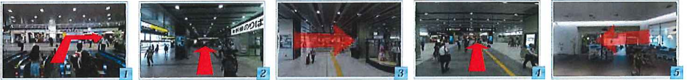
1 JR 東海道線新大阪駅 東口改札口を出て、右へ 2 新幹線改札（南口）前を通過して 3 文楽人形の目印を右へ 4 そのまま新幹線改札（中央口）の前を通過 5 つきあたりを左へ曲がりります