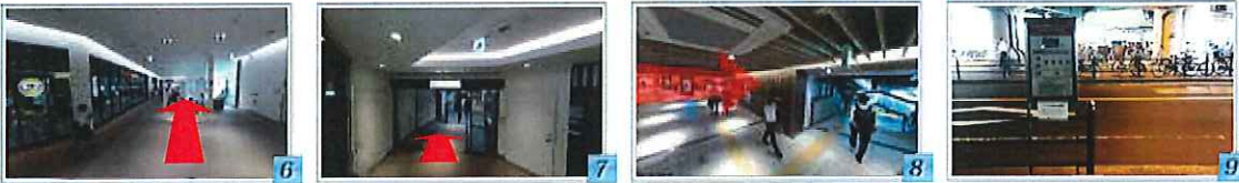
6 下りエスカレーターを降り 7 そのまま直進 8 右手、2号出入口の下り階段を降りて左へ。歩道沿いに進みます 9 右手にピンク色の看板 ホテル大阪ガーデンパレス シャトルバス乗り場があります