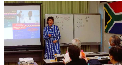
南アフリカ出身JET-ALTによるセミナー