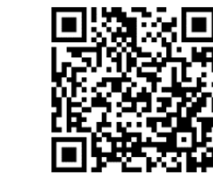
木花中学校区の紹介動画リンク (QRコード)