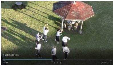
久峰中学校区の紹介動画