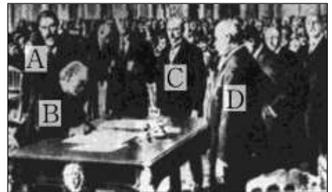
図 (2) この条約が結ばれた年に①朝鮮、②中国でおこった運動を、次のア~オから 1 つずつ選び、記号を書きなさい。また、③インドで非暴力・不服従を唱え、イギリスからの完全な自治を求める運動を指導した人物を書きなさい。