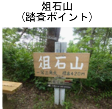
俎石山 (踏査ポイント)

大阪府と和歌山県の県境西部に位置する標高420mの山です。山頂は北峰と南峰に分かれており、北峰からの展望は絶景です。