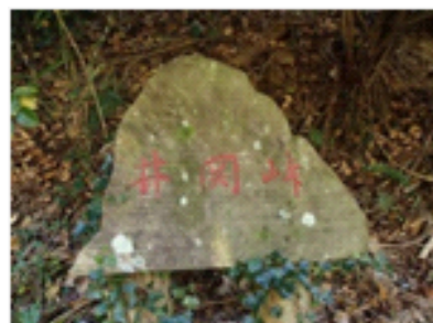
井関峠(踏査ポイント)

大阪府と和歌山県の県境西部に位置する標高420mの山です。山頂は北峰と南峰に分かれており、北峰からの展望は絶景です。