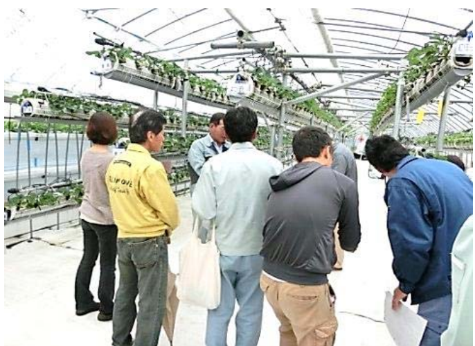
▲中空培地を利用した栽培システムの現地視察

また、（地独）大阪府立環境農林水産総合研究所が開発した「中空培地を利用した栽培システム」導入園（堺市）の協力を得て視察研修会を開催しました。