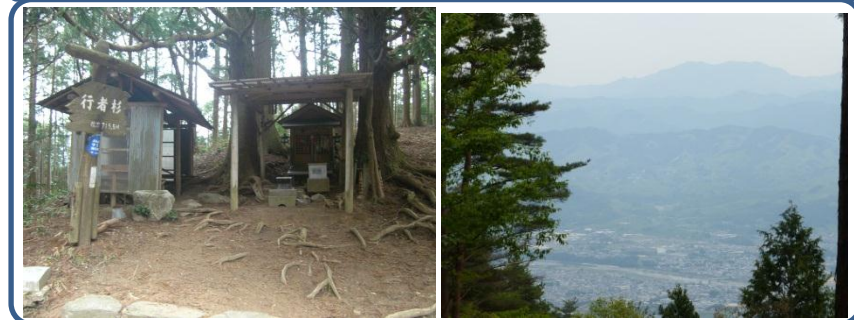
「東ノ行者」「五本杉」とも呼ばれています。