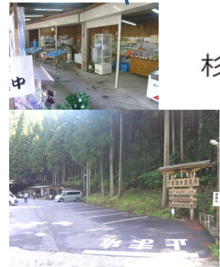
行者湧水直売所 (石見川口バス停の北側約300m)