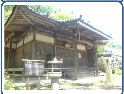
「目の薬師」と言われています