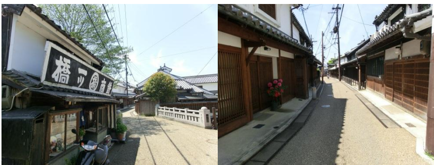
新町通り (JR五条駅南側)