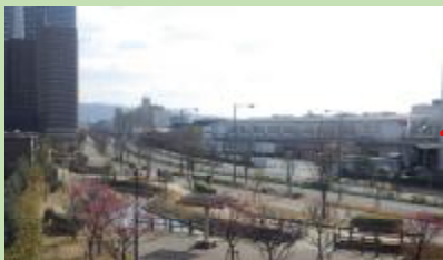
処理施設の上にスポーツ施設 やスーパーマーケット等があるよ！