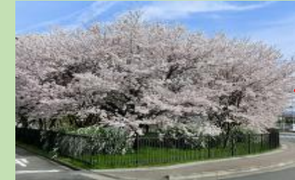
お花見スポットとしても！