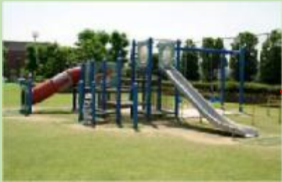
滑り台など遊具もたくさん！