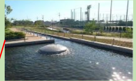
せせらぎには処理水が流れているよ！