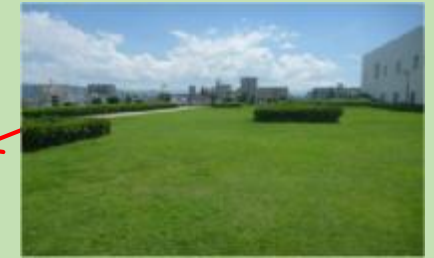
多目的に使用できる芝生広場があるよ！