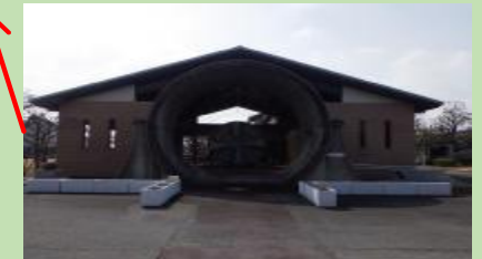
流域下水道管きよのモニュメントと実際に工事使用されたシールドマシンがあるよ！