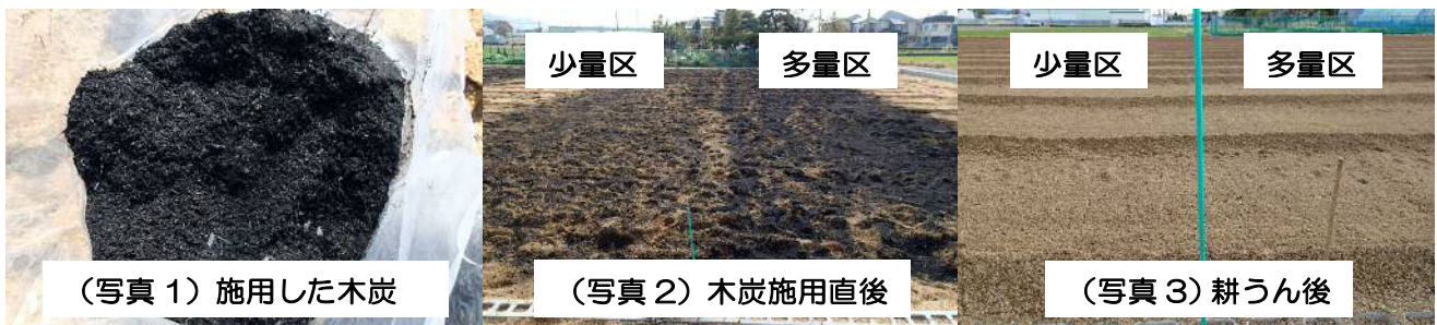
（写真 1）施用した木炭

当事務所では、平成 28 年 11 月中旬に（地独）大阪府立環境農林水産総合研究所の協力を得て、水田に真砂土を約 1,500m 3 客土したほ場において、9mm メッシュで篩った木炭（写真 1）を 10a あたり約 1,000kg 施用した多量区、333kg 施用した少量区、無処理区を合計 9 区（各区 3 反復）設置しました。木炭施用後の土壌表面は写真 2 のように真っ黒になりますが、耕うんすると、写真 3 のように遠目には木炭が分からない状態になりました。