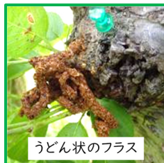
うどん状のフラス