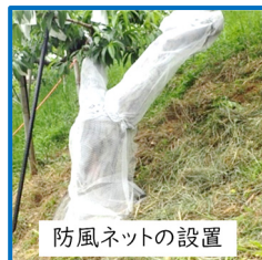
防風ネットの設置