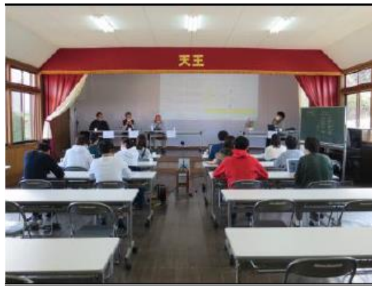
里山の本音、座談会にて地元の方の考え等をお伺いしました