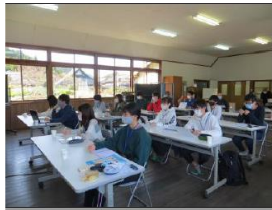
学生から多くの質問があがり、時間が足りないほどでした