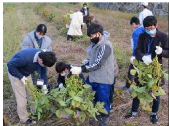
黒枝豆の収穫を行いました。とった枝豆は翌日の朝食になりました