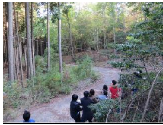
参加者全員で力を合わせ、木を伐採しました