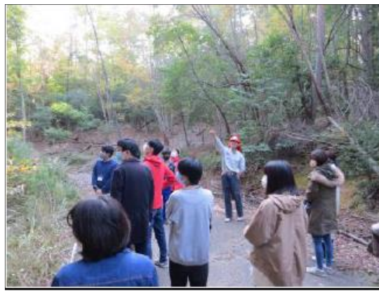
林業の実績についてお話を伺いました