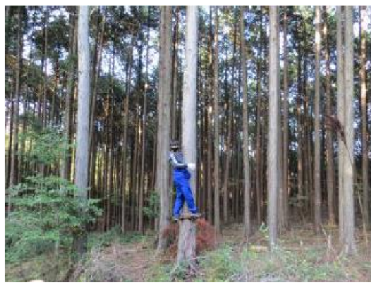
道具一つで足場を作り、木を登っていく経験もしました