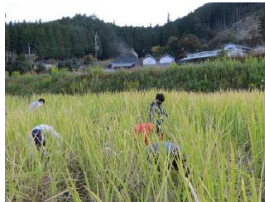
マコモダケの収穫を行いました